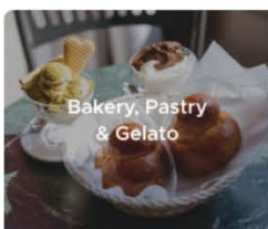
烘焙, 甜品与冰淇淋