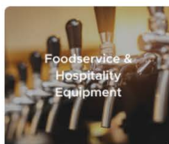
食品服务与酒店设备